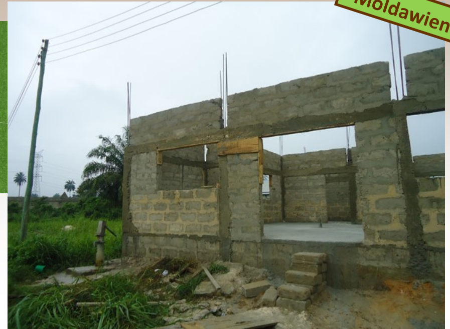
Bau einer Bäckerei. Fertigstellung 2018

Im Jahr 2018 möchten wir mit Hilfe der Südtiroler Landesregierung eine PV-Anlage mit ca. 25 Kwp Leistung errichten. Dadurch können wir sehr viele Kosten einsparen.